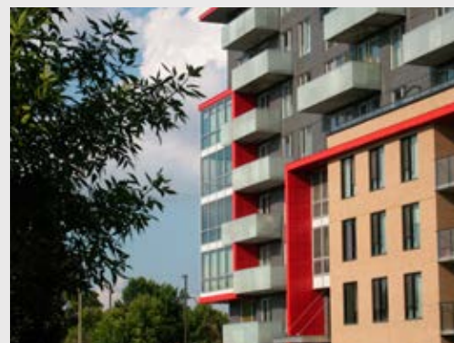
Ville de Montréal

Cette intervention urbaine majeure vise à structurer un secteur névralgique du centre-ville de Montréal. Planifiée par phases, elle a une incidence au-delà de l'établissement universitaire et englobe un ensemble d'organisations locales et groupes communautaires qui partagent une vision à long terme. Les importants investissements immobiliers de l'Université Concordia contribuent fortement à revitaliser le quartier.